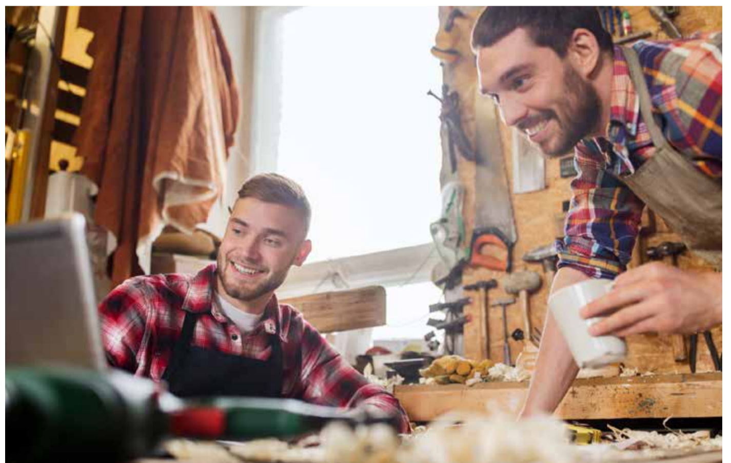
Ein Grundstück am Landshuter Bahnhof könnte für einen Handwerkerhof genutzt werden. Eine gebündelte Ansiedlung von Handwerksbetrieben in der Innenstadt bietet für alle Beteiligten Vorteile.

Die Stadt bietet Gewerbefläche zu erschwinglichen Preisen an – vorzugsweise für junge Handwerker und Existenzgründer. In Landshut könnte dafür ein Grundstück an der Bahn genutzt werden. Durch die Ansiedelung unterschiedlicher Gewerke können Synergien entstehen und natürlich Arbeits- und Ausbil-