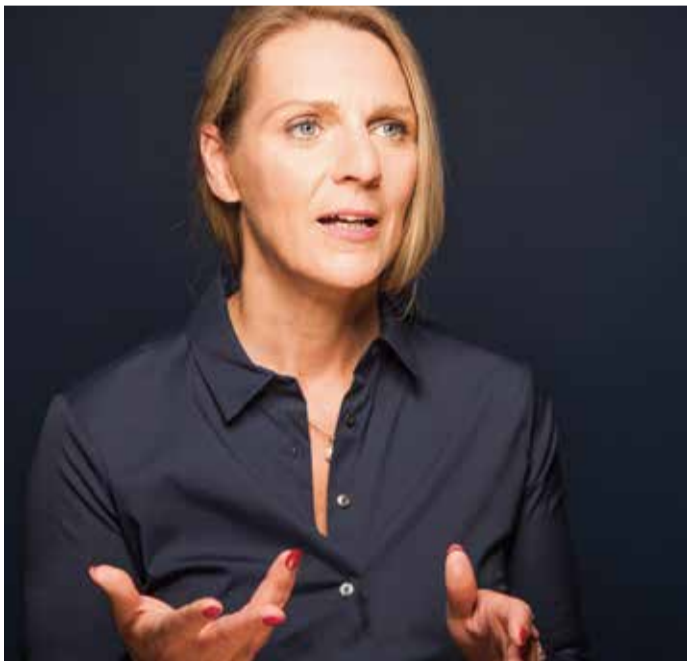
Es ist unsere Aufgabe, die Gesellschaft noch viel stärker als bisher für dieses Thema zu sensibilisieren – auch unsere Jüngsten.

„Nein heißt nein!“ mit der Reform des § 177 des Strafgesetzbuches sind Frauenrechte bei sexuellen Angriffen massiv gestärkt worden.